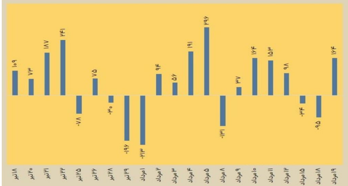
تغییرات بازارهای جهانی در هفته منتهی به ۱۴۰۱/۰۵/۲۱